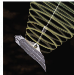
Анкер готов к нагрузке