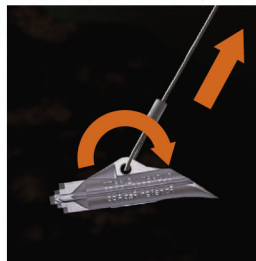
Потяните за трос