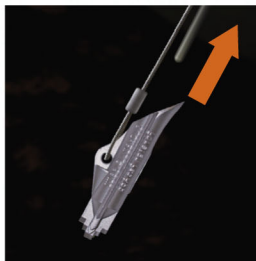
Извлеките стальной толкатель